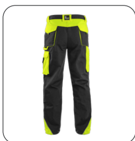
zadní strana back side z tyłu