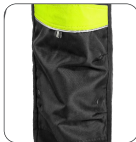
zdvojená kolena s možností vložení kolenních výztuh reinforced knees with possibility to insert knee pads podwójne kolana z możliwością włożenia nakolanników