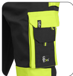
multifunkční vaková kapsa multifunctional sac pocket kieszeń wielofunkcyjna