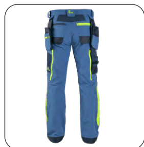
zadní strana back side z tyłu