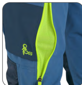
ventilace na stehně thigh ventilation wentylacja na nogawce