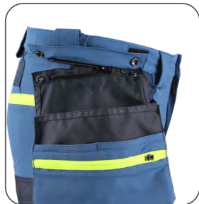
odepínací kapsy detachable pockets odpinane kieszenie