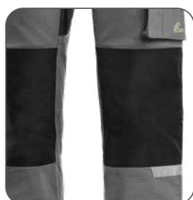
kolena zesílena 600D polyesterem kolená vystužené polyesterom 600D knees reinforced by 600D polyester kolana wzmacnione poliestrem 600D