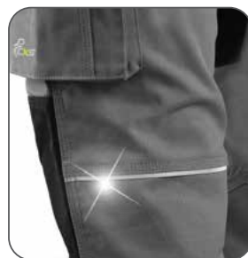
reflexní doplňky reflexné doplnky reflective accessories elementy odblaskowe