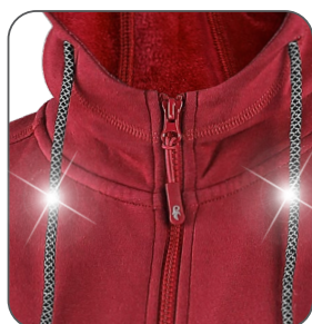
reflexní tkanice reflexné šnúrky reflective strings sznurówki odblaskowe