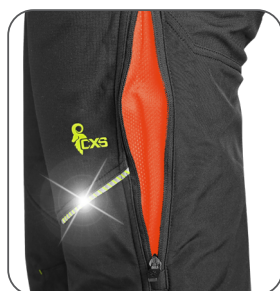
ventilace na stehně thigh ventilation wentylacja na nogawce