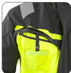
náprsní kapsa s odnímatelným pouzdrům ID karty náprsné vrecko s odnímateľným puzdrom na ID karty chest pocket with detachable ID card holder kieszeń na piersi z miejscem na ID kartę