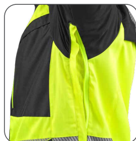
ventilace v podpaží ventilácia v podpaží underarm ventilation wentylacja pod pachami