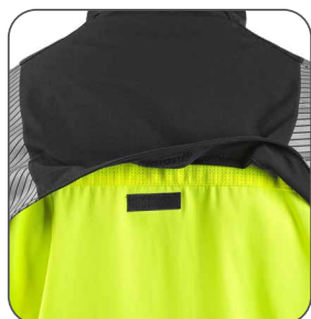
ventilace na zádech ventilácia na zadnej strane back side - ventilation wentylacja z tyłu