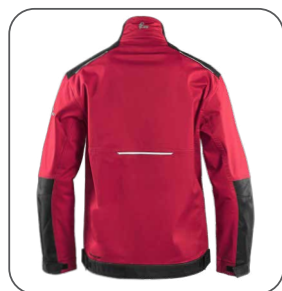
zadní strana zadná strana back side z tyłu