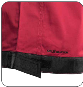
regulace v pase regulácia v páse adjustable waist regulowany pas