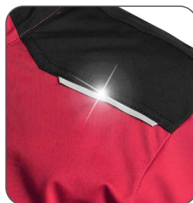
reflexní doplňky reflexné doplnky reflective accessories elementy odblaskowe