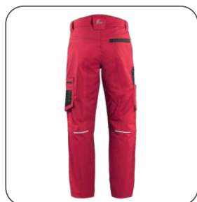
zadní strana zadná strana back side z tyłu