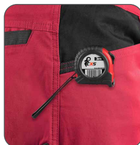
kapsa s vyztužením pro zavěšení metru vrecko s výstužou na zavesenie metra pocket with reinforcement for hanging a measuring tape kieszeń z wzmocnieniem do zawieszenia miarki