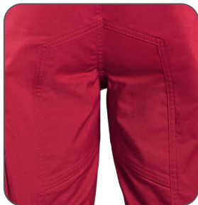
zesílený sed zosilnený sed reinforced seat wzmocnienie w kroku