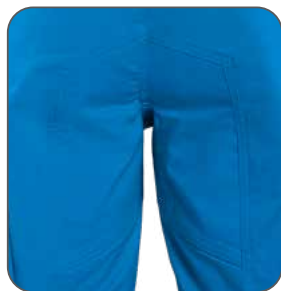
zesílený sed zosilnený sed reinforced seat wzmocnienie w kroku