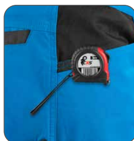
kapsa s vyztužením pro zavěšení metru vrecko s výstužou na zavesenie metra pocket with reinforcement for hanging a measuring tape kieszeń z wzmocnieniem do zawieszenia miarki