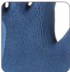
zdrsňený povrch crinkle finish szorstkie wykończenie