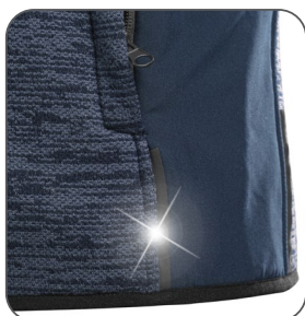
reflexní doplňky reflexné doplnky reflective accessories elementy odblaskowe