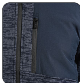
náprsní kapsa náprsné vrecko chest pocket kieszeń na piersi