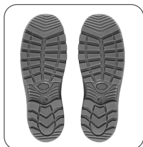
podešev outsole podeszwa