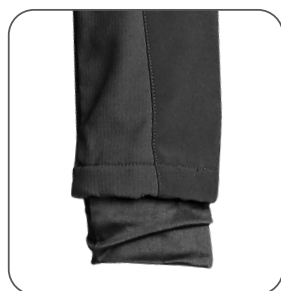
vnitřní manžeta v rukávu inner cuff wewnętrzny mankiet