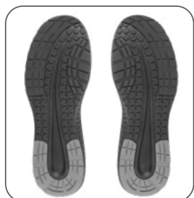
podešev podošva outsole podeszwa