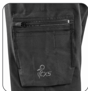
levá boční kapsa levé bočné vrecko left side pocket lewa kieszeń boczna