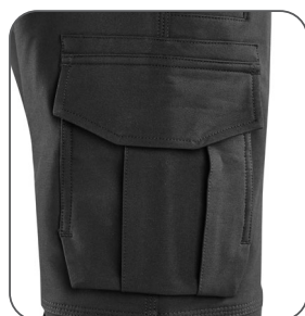
pravá boční kapsa s vnitřní kapsou na mobil pravé bočné vrecko s vnútorným vreckom na mobil right side pocket with an inner phone pocket prawa kieszeń boczna z wewnętrzną kieszenią na telefon