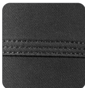
trojité prošití trojité prešitie triple stitching potrójne szwy